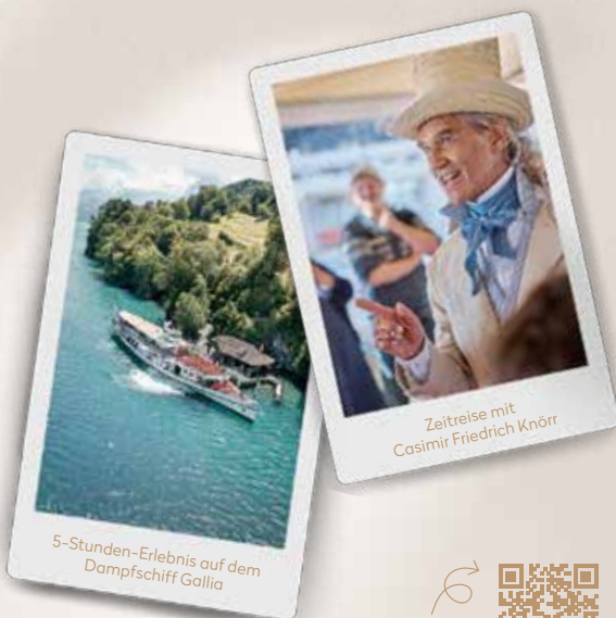
5-Stunden-Erlebnis auf dem Dampfschiff Gallia